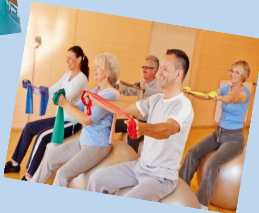
Wirbelsäule Osteoporose Gymnastik